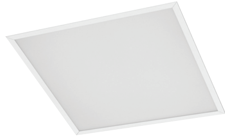
Clean A / Clean C